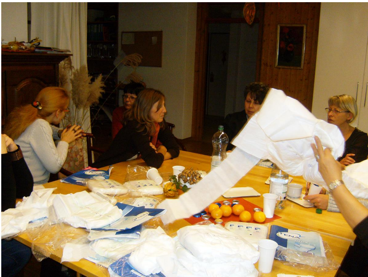
So viel Material