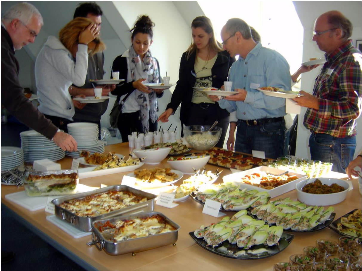
Wer die Wahl hat...