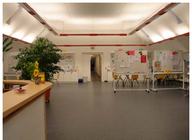
in die grosszügigen Räume im Freidorf