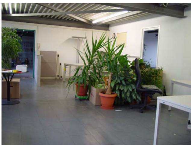
Am Zügeltag von der Herrenmattstrasse