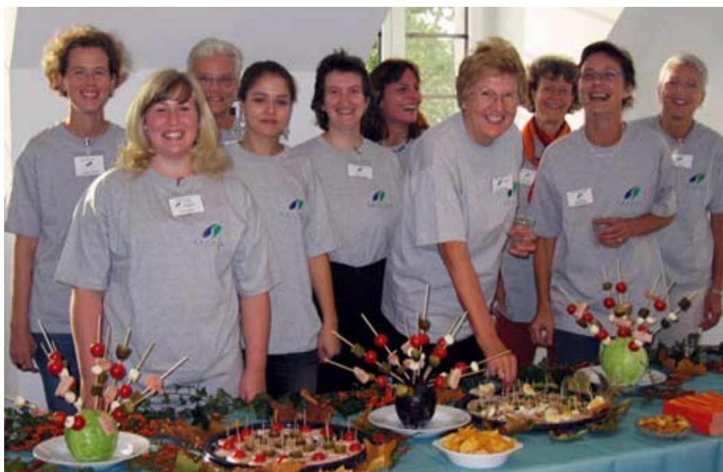
Fröhliche Helferinnen am Tag der offenen Tür.